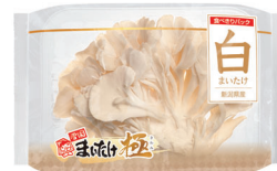
雪国まいたけが生産している各種きのこ健康食品