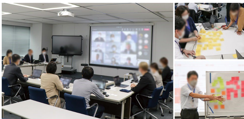
当社社員によるワークショップでの対話の様子