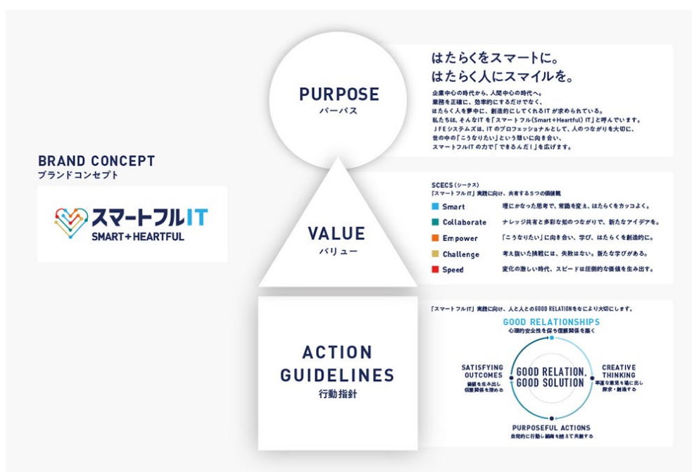
JFEシステムズ株式会社 企業理念体系図

このたび、当社は2023年9月に会社設立40周年を迎えることを機に、企業理念を刷新いたしました。当社の存在意義を「パーパス」として言語化するとともに、パーパスの実践に向けて共有する価値観である「バリュー」と、行動の基本方針である「行動指針」を制定し、社員が業務に取り組む際のよりどころとなる基軸を示すとともに、当社が何を信じ、どのように社会に貢献していくのかを表現しました。また、パーパスをシンプルに表現した「ブランドコンセプト」を新たに制定いたしました。